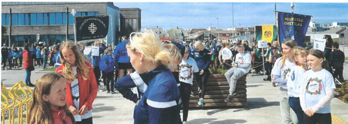
Oppstilling før toget.

Haugesund Turnforening, 21. mai – 22. mai 2022